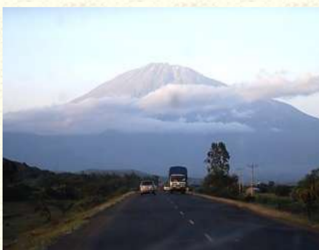
Fotoobrazy-Michalala, Afrika, 2013