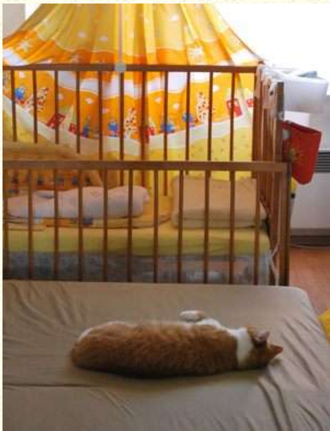
Kocour se postupně vyrovnává se ztrátou pozice největšího mazlíka.