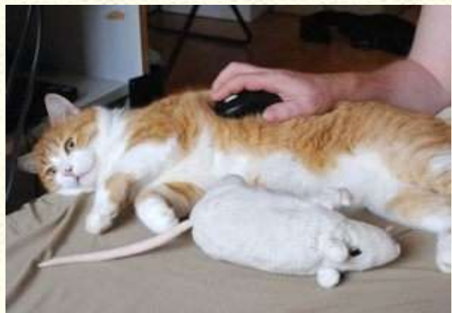
Kocour jako podložka pod myš.