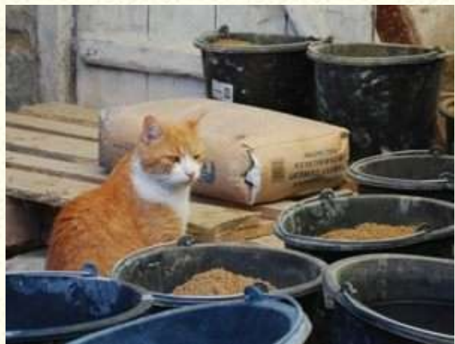
Kocour jako stavební dozor.